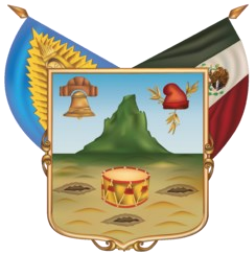
Estado Libre y Soberano de Hidalgo